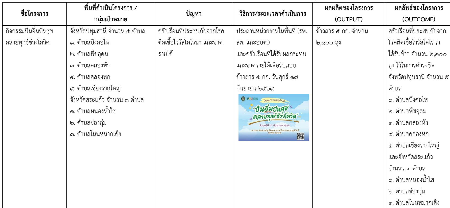
ตารางที่ ๒๓: โครงการ/กิจกรรมที่มหาวิทยาลัยราชภัฏรำไพพรรณีดำเนินการช่วยเหลือท้องถิ่น ในช่วงหลังการแพร่ระบาด COVID-๑๙ (ระยะฟื้นฟู)